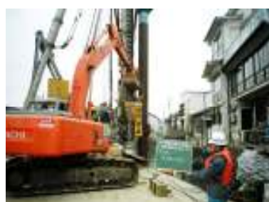
⑥補強材(碎石)投入、締固め