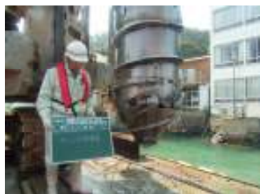
①ケーシング三枚シュー閉合